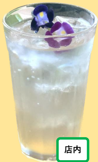
ハニービネガーソーダ ¥380-