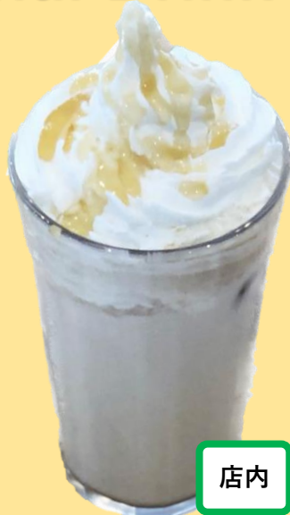
はちみつきなこラテ ¥450-