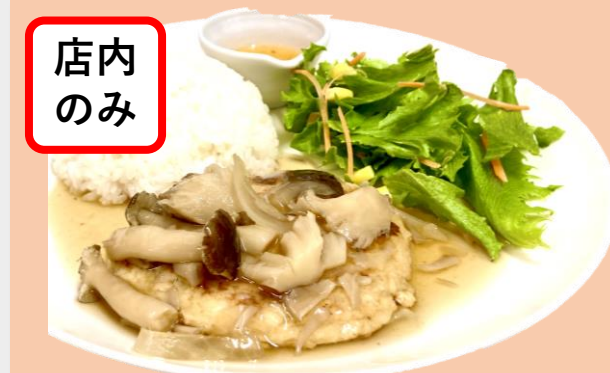
もっちり里芋のあんかけハンバーグランチ ¥1,100-