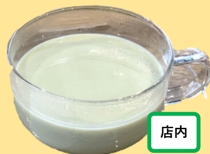
狭山茶ハニーミルクティー ¥380-