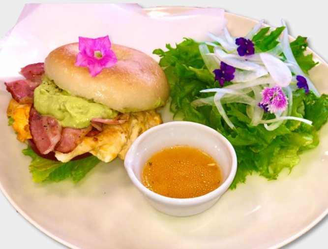
花畑ランチプレート ¥1,320-